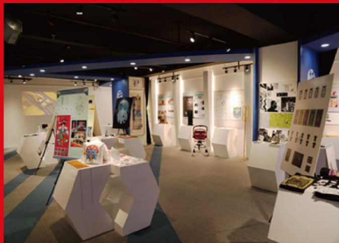
图为工业设计研究院-创意设计展厅

学院教学设施完善，现有电脑工作站、苹果电脑150台，多媒体教室15间，多功能展厅2间(1200平米)，以及高端喷墨打印机、高端扫描仪等大批先进教学设施。艺术设计实验中心于2009年被评为省级实验教学示范中心，配有三维激光电脑雕刻、模型制作、快速成型等先进设备。由香港知名爱国乡贤、华侨大学董事庄善春、郑启銓伉俪捐资兴建的善春启銓艺术教学楼，秀丽典雅，精巧别致，为学院的教学、科研和行政办公提供了良好的环境。