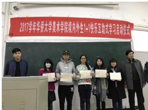
图为境内外生1+1快乐互助学习启动仪式

★主办各类境内外大型艺术展，如第十二届亚洲设计文化学会国际研究发表大会，第四、五届全国架上连环画展，“海丝情”——华大、台师大及两岸侨界美术书法摄影展。