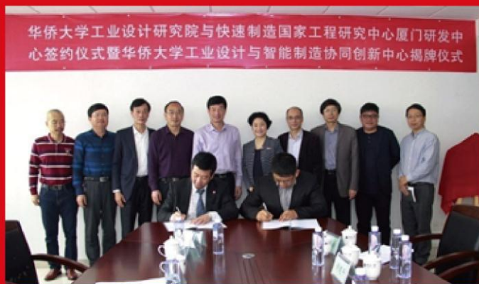
图为华侨大学工业设计与智能制造协同创新中心揭牌仪式