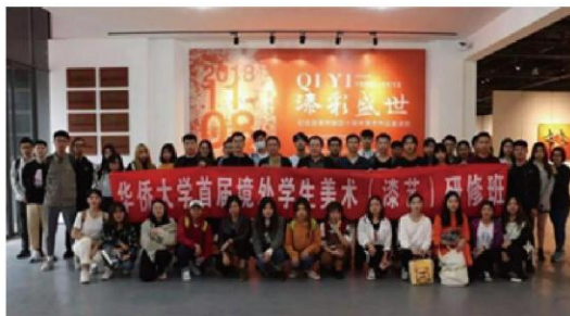
图为首届境外学生美术（漆艺）研修班