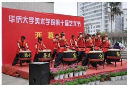
图为美术学院艺术节开幕式

学院始终坚持立德树人教育根本任务，围绕艺术创作这一中心，依托学院展览馆、学生画室等平台，展示各具特色的作品，既是学生青春活力、积极向上的现实写照，更是当代大学生创造力、想象力的展示。富有学院专业特色的艺术节从2000年开始，至今已成功举办了十八届。艺术节已发展成集艺术作品大赛、艺术论坛、艺术作品展览、专家点评及颁奖晚会于一体的艺术作品盛宴，活动的开展极大地提高了广大学生的综合素质，对学生创新精神、创造能力产生广泛而深远的影响。