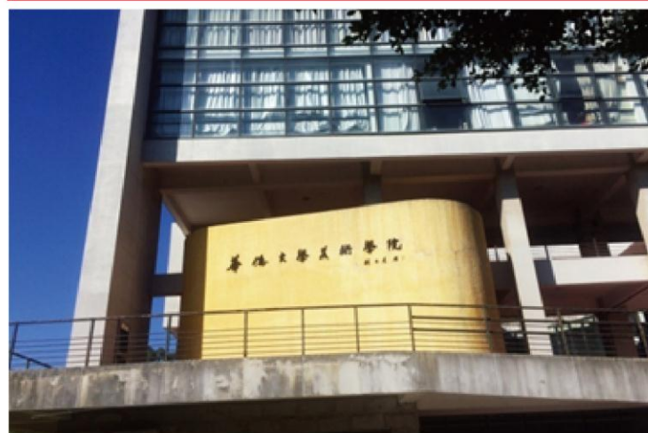
图为美术学院教学楼