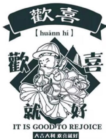
2018丝路精神—西部国际设计双年展获奖作品《欢喜就好》 (作者：黄蓉 指导教师：孟凡军)