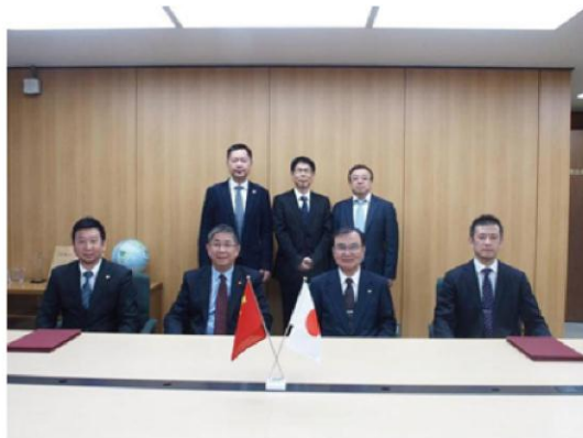
图为与日本千叶大学签订校际合作协议