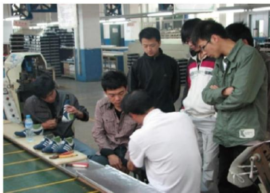
图为学生到企业实践