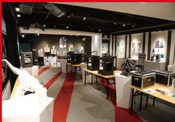
图为工业设计研究院-协同创新成果展厅