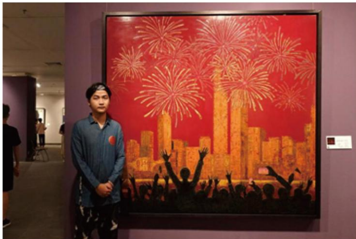
第十三届全国美展入选漆画作品《焰彩香江辉—归来》 (作者: 袁景希 指导教师: 金程斌)