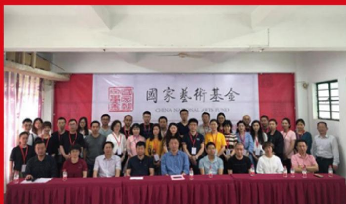
图为国家艺术基金2019年艺术人才培养资助项目《华人华侨爱国故事青年绘本创作人才培养》集中培训开班仪式