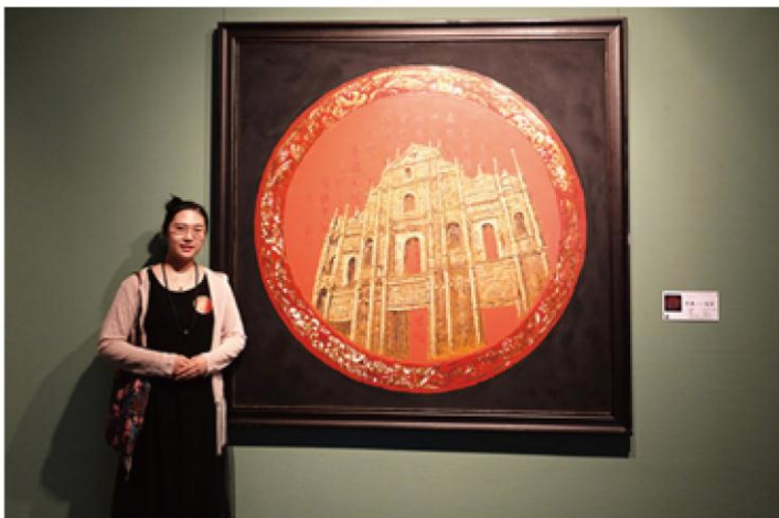
第十三届全国美展入选漆画作品《怀澳—包容》 (作者: 李淑娟 指导教师: 金程斌)