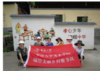
图为墙绘美丽乡村服务队